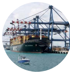
巴哈馬的自由港貨櫃碼頭