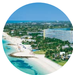
Grand Lucayan 是巴哈馬最大的度假酒店