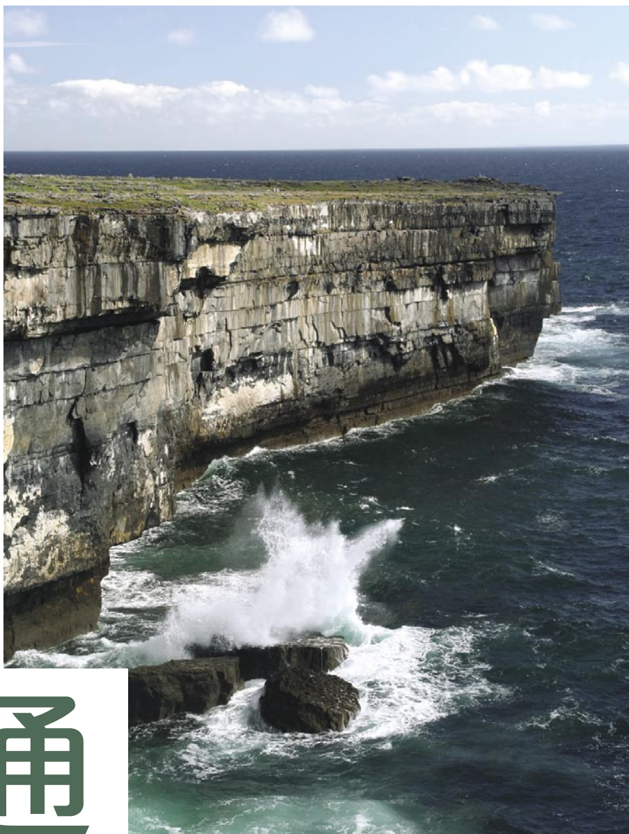
阿倫群島上的懸崖峭壁。