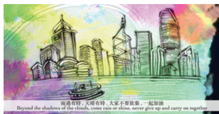
眾志成城，各界伸出援手，義助拍攝「應急錢」計劃的申請視頻指南。